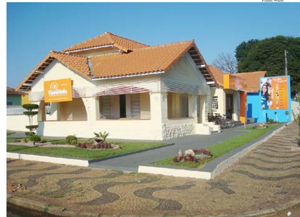
Fachada da Visual Mídia (Unidade de Leme)

O principal diferencial da Visual Mídia é seu método de ensino que tem como compromisso oferecer os melhores produtos e serviços para seus alunos, além de gerar soluções que permitam sua inserção no mercado de