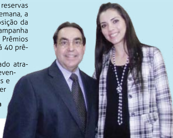
Nathália C. M. Silva / ACIL