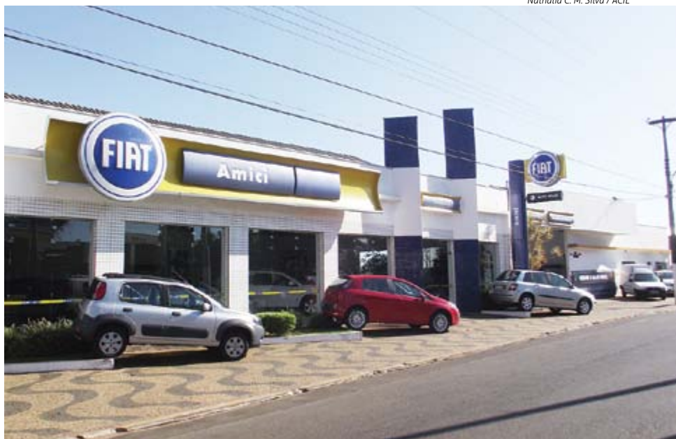
Fachada da Amici

A Amici oferece toda gama dos produtos da Fiat. São mais de 60 modelos de veículos, ou seja, uma