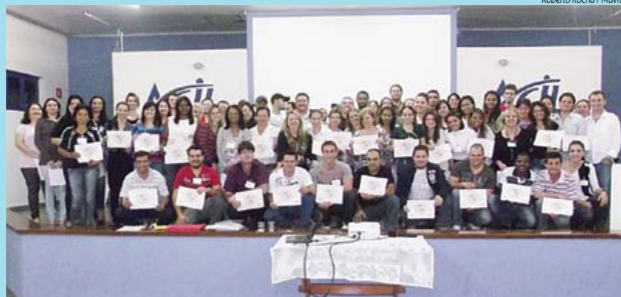
Participantes do Curso de Liderança Comportamental recebem certificado

Esse curso teve como objetivo ensinar o líder a usar melhor seu potencial, estimulando o desenvolvimento de comportamentos positivos com a equipe. Os participantes aprenderam a se conhecer, viver e atuar de maneira positiva nas situações diárias, usando melhor o poder da comunicação e persuasão.