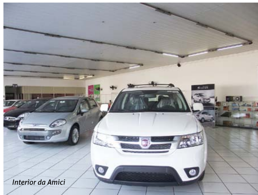
Interior da Amici

Contatos: Rua Rafael de Barros, 1400 Centro - Leme/SP Tel.: 3571-6565 Site: www.amici.com.br