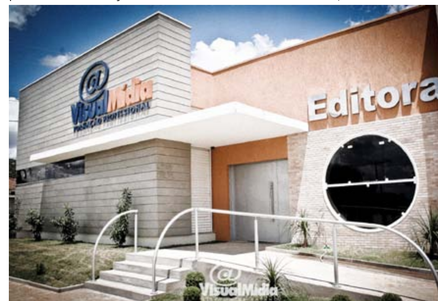
Editora Visual Mídia, situada em Santa Rita do Passa Quatro, onde é produzido todo material didático e promocional da rede

Contatos: Visual Mídia Formação Profissional Rua João Pessoa, 539 – Centro Fones: 3554-7042 / 3554-7043 www.visualmidialeme.com.br