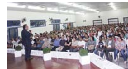
Mais de 400 pessoas lotam o Salão de Eventos para prestigiar o evento