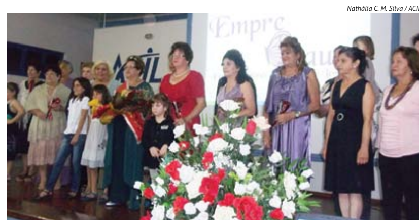
Nathália C. M. Silva / ACIL